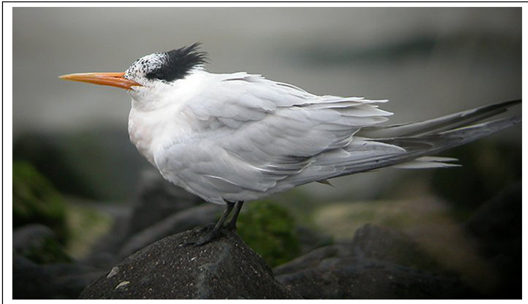
Abb.2: Schmuckseeschwalbe Sterna elegans , Brokdorf, Schleswig-Holstein, Oktober 2004.

Zahlreiche Clubmitglieder nutzen während der folgenden Tage die wohl einmalige Gelegenheit, diese Art in heimischen Gefilden beobachten zu können und nahmen notfalls auch längere Anfahrtswege in Kauf. Die Schmuckseeschwalbe wurde letztmalig am 5. Oktober in leider deutlich geschwächerter Verfassung vor dem Kraftwerk beobachtet.