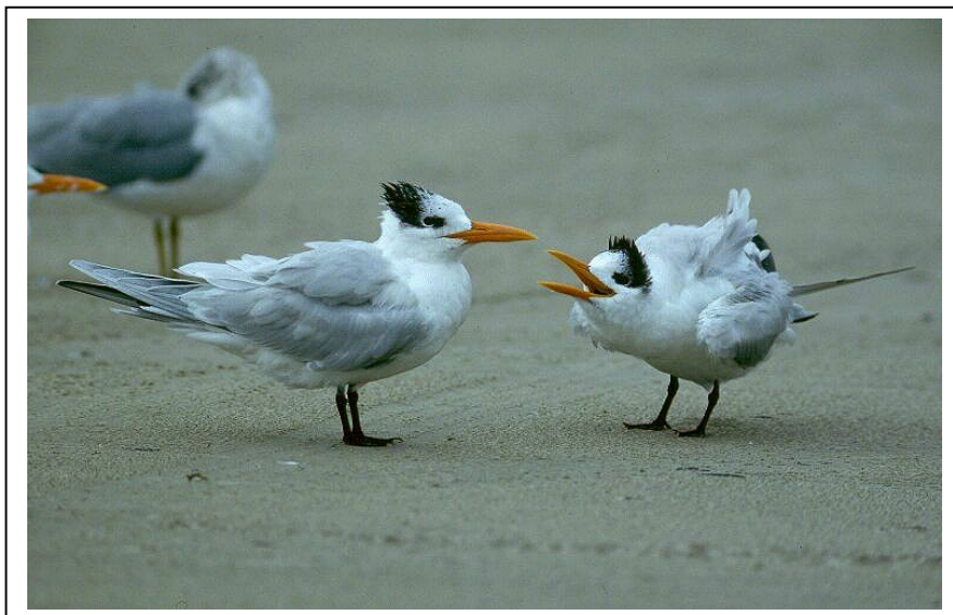
Abb.11: Königsseeschwalbe Sterna maxima , Galveston, Texas, Dezember 1994 (Axel Halley). Die meiste Zeit des Jahres tragen Königsseeschwalben die schwarze 'Winterkappe' mit dem deutlich isolierten Auge. Die Schnabelform ist ganzjährig das beste Einzelkriterium zur Unterscheidung gegenüber der Schmuckseeschwalbe (Kaufman 1990: 151). Schwierig kann bei Irrgästen in unseren Breiten auch eine Unterscheidung zwischen Königs- und Rüppellseeschwalbe sein. Die Rüppellseeschwalbe ist schon in Deutschland nachgewiesen worden. Die Königsseeschwalbe ist bis nach Spanien, Großbritannien und Norwegen gelangt, wobei Ringfunde eines spanischen sowie eines britischen Vogels deren Herkunft aus Nordamerika belegen (Dennis 1994, Lewington et al. 1991: 162).

Beim Auftreten orangeschnäbeliger Seeschwalben in unseren Regionen besteht grundsätzlich eine Verwechslungsmöglichkeit auch mit der (afrikanischen Unterart der) Königsseeschwalbe S. maxima (albididorsalis) (Dubois 1991, Wheeler 1989, Link 18, 21, Abb.11). Allein der im Vergleich zur Schmuckseeschwalbe massivere Schnabel mit deutlichem Gonyseck schließt diese Art jedoch eindeutig aus. In Link 5 können beiden Arten nebeneinander auf einem Foto verglichen werden.