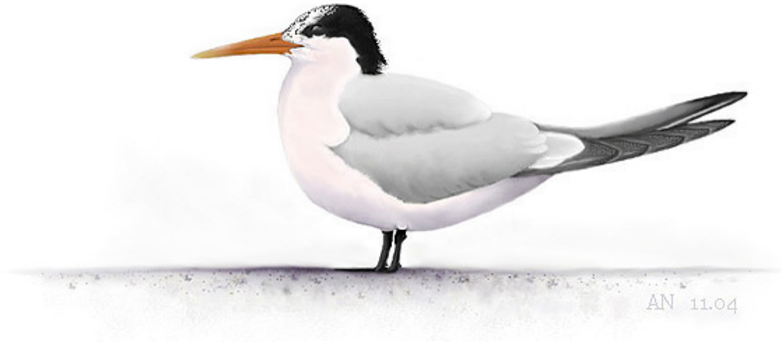
Schmuckseeschwalbe, Brokdorf 2004 (Andreas Noeske)

ABSTRACT An Elegant Tern Sterna elegans was present at Brokdorf, Schleswig-Holstein, from 26th September to 5th October 2004. The bird stayed at the outlet of a nuclear powerstation at the River Elbe where it was subsequently seen and photographed by many birders. The tern was first identified as a possible Lesser Crested S. bengalensis . But in the morning of the 27th it was commonly agreed that it was indeed Germany's first Elegant Tern. The identification was based on a combination of a long, narrow, orange bill, winter-type black cap encompassing the eye, long crest, strong pink flush to the underparts, pale grey upperparts and whitish rump. Identification was confirmed by Klaus Malling Olsen, Denmark, and Alvaro Jaramillo, California. More photographs can be found in the Club300 Gallery.