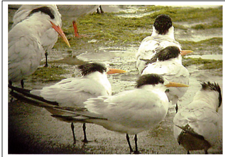
Abb.6: Schmuckseeschwalben Sterna elegans , Princeton Harbour, Kalifornien, USA, 16. Oktober 2002.

Der Vogel hinten links zeigt die klassischen Merkmale einer Schmuckseeschwalbe: langer Schopf, dunkel eingefasstes, nicht abgesetztes Auge und langer, dünner, leicht gebogener Schnabel, der an der Basis deutlich orange gefärbt ist und zur Spitze gelblicher wird. Der adulte Vogel im Vordergrund hat einen sehr kurzen, geraden sowie gelben Schnabel, wie er sonst für Cayenneseeschwalben S. sandvicensis eurygnatha (gelbschnäbelige Form der Brandseeschwalbe in Südamerika) typisch ist (Link 10 - 14).