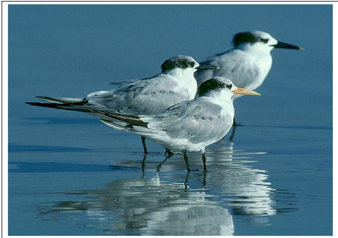
Abb.8: Rüppellseeschwalbe Sterna bengalensis und Brandseeschwalben S. sandvicensis , Khor Taqah, Oman, Dezember 1998 (Axel Halley).

Rüppellseeschwalben haben eine dunklere graue Oberseite als Brandseeschwalben. Auf diesem Foto ist ein Unterschied allerdings kaum zu erkennen. Direkte Sonneneinstrahlung und Reflektionen an der Federstruktur verhindern oft eine exakte Einschätzung des Grautons. Unter standardisierten Laborbedingungen ist der Unterschied dagegen gut zu erkennen, wie das Foto der Bälge in Link 2 zeigt.