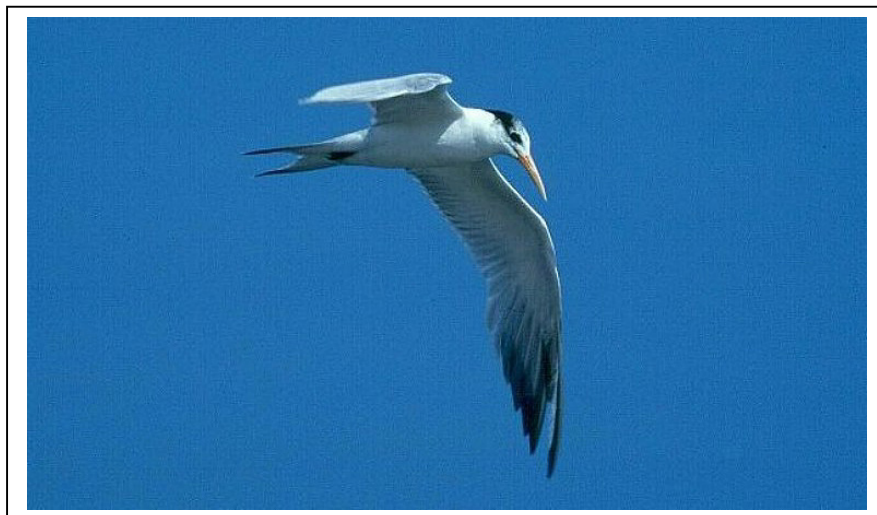
Abb.9: Rüppellseeschwalbe Sterna bengalensis , Dibba, Vereinigte Arabische Emirate, Dezember 1992.

Rüppellseeschwalben haben eine dunklere graue Oberseite als Brandseeschwalben. Auf diesem Foto ist ein Unterschied allerdings kaum zu erkennen. Direkte Sonneneinstrahlung und Reflektionen an der Federstruktur verhindern oft eine exakte Einschätzung des Grautons. Unter standardisierten Laborbedingungen ist der Unterschied dagegen gut zu erkennen, wie das Foto der Bälge in Link 2 zeigt.