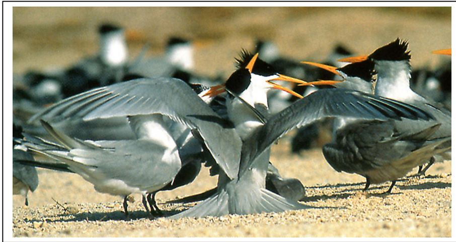
Abb.10: Rüppellseeschwalben Sterna bengalensis , Karan, Saudi-Arabien, Juni 1991 (Arnoud van den Berg). Auch bei der starken Sonneneinstrahlung ist hier zu erkennen, dass die graue Oberseite dunkler ist als bei Schmuckseeschwalben. Bürzel und Schwanz haben den gleichen Grauton wie Rücken und Flügel.

Beim Auftreten orangeschnäbeliger Seeschwalben in unseren Regionen besteht grundsätzlich eine Verwechslungsmöglichkeit auch mit der (afrikanischen Unterart der) Königsseeschwalbe S. maxima (albididorsalis) (Dubois 1991, Wheeler 1989, Link 18, 21, Abb.11). Allein der im Vergleich zur Schmuckseeschwalbe massivere Schnabel mit deutlichem Gonyseck schließt diese Art jedoch eindeutig aus. In Link 5 können beiden Arten nebeneinander auf einem Foto verglichen werden.