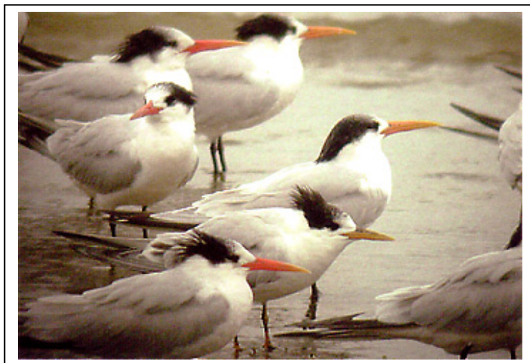
Abb.7: Schmuckseeschwalben Sterna elegans , Princeton Harbour, Kalifornien, USA, 16. Oktober 2002.

Der Vogel hinten links zeigt die klassischen Merkmale einer Schmuckseeschwalbe: langer Schopf, dunkel eingefasstes, nicht abgesetztes Auge und langer, dünner, leicht gebogener Schnabel, der an der Basis deutlich orange gefärbt ist und zur Spitze gelblicher wird. Der adulte Vogel im Vordergrund hat einen sehr kurzen, geraden sowie gelben Schnabel, wie er sonst für Cayenneseeschwalben S. sandvicensis eurygnatha (gelbschnäbelige Form der Brandseeschwalbe in Südamerika) typisch ist (Link 10 - 14).