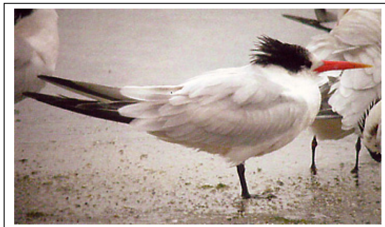
Abb.5: Schmuckseeschwalbe Sterna elegans , Princeton Harbour, Kalifornien, USA, 16. Oktober 2002.

Dieser adulte Vogel hat einen sehr kräftig rötlich-orange gefärbten Schnabel, der darüber hinaus recht kurz und gerade ist; das Gonyseck befindet sich etwa auf halber Schnabellänge oder sogar etwas näher zur Basis. Obwohl der Schnabel dem einer Rüppellseeschwalbe S. bengalensis sehr ähnlich scheint, beträgt das Verhältnis Schnabellänge zu –höhe nach diesem Foto dennoch mindestens 5:1. Das Gonyseck kann bei elegans und bengalensis mittig platziert sein, bei Schmuckseeschwalben aber auch näher zur Basis, bei Rüppellseeschwalben näher zur Schnabelspitze. Bei sehr langschnäbeligen Exemplaren ist es oft gar nicht erkennbar. Der Schopf erscheint hier kurz, die Länge ist aber aufgrund der Haltung nicht zu beurteilen.