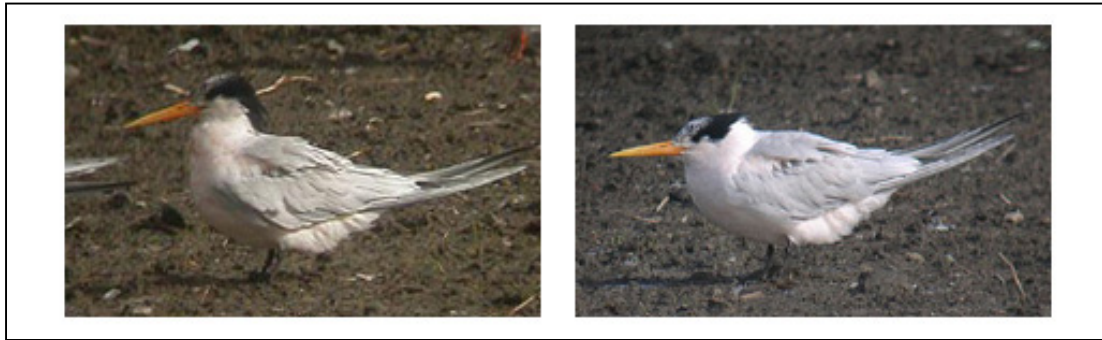
Abb.3: Schmuckseeschwalbe Sterna elegans, Brokdorf, Schleswig-Holstein, 27.09.2004.