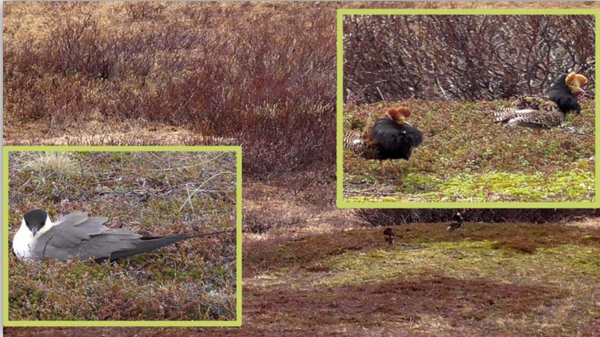
Falkenraubmöwe [ Stercorarius longicaudus ] und Kampfläufer [ Stercorarius parasiticus ].

Im Allgemeinen waren wir darauf bedacht nach Möglichkeit die Wege nicht zu verlassen, um die Tiere nicht zu stören. Bei der Suche nach dem Mornell in der Nähe des Schnee-Eulenparkplatzes (das war der Tipp eines Birders) gelang uns das nicht. Es gab keine Wege. Wir fanden aber den Mornell dennoch nicht. Sahen aber im Gebiet Rotkehlpieper, Ohrenlerche, Schneeammer, Sterntaucher, Eistaucher und Eisenten.