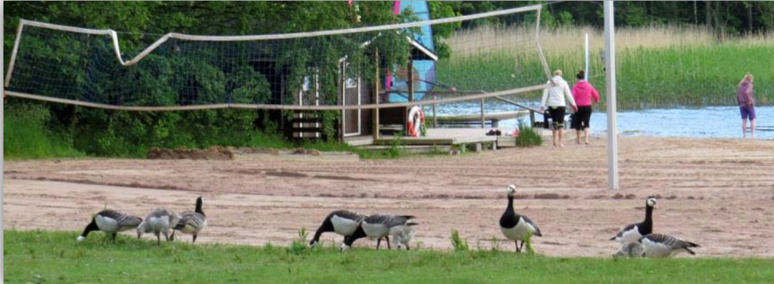
Weißwangengänse [ Branta leucopsis ] am Strand des Zeltplatzes

Am 26.06.2015 geht die Fähre früh um 8:00 Uhr. Wir haben zwei Tage Zeit und buchen auf dem Zeltplatz von Turku wiederum eine feste Unterkunft. So müssen wir am 26.06.2015 früh nicht das Zelt abbauen.