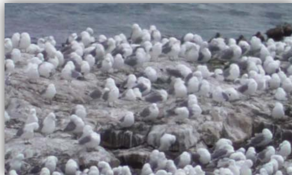
Dreizehenmöwen [ Rissa tridactyla ]

Auf einer kleinen Straße bei Komagvær im Hochland begegneten wir der ersten Falkenraubmöwe. Die Falkenraubmöwen haben eine andere Flugweise als die häufigeren Schmarotzerraubmöwen. Einmal sahen wir einen Vogel scheinbar auf einer Telegraphenleitung sitzen. Beim genaueren Betrachten durchs Fernglas stellte sich heraus dass die Telegraphenleitung viel weiter im Hintergrund war und eine Falkenraubmöwe mit ausgebreiteten Flügeln ohne Flügelschlag im Gegenwind davor in der Luft stand. Es fiel auf, je weiter wir nach Norden fuhren umso mehr Falkenraubmöwen sahen wir.