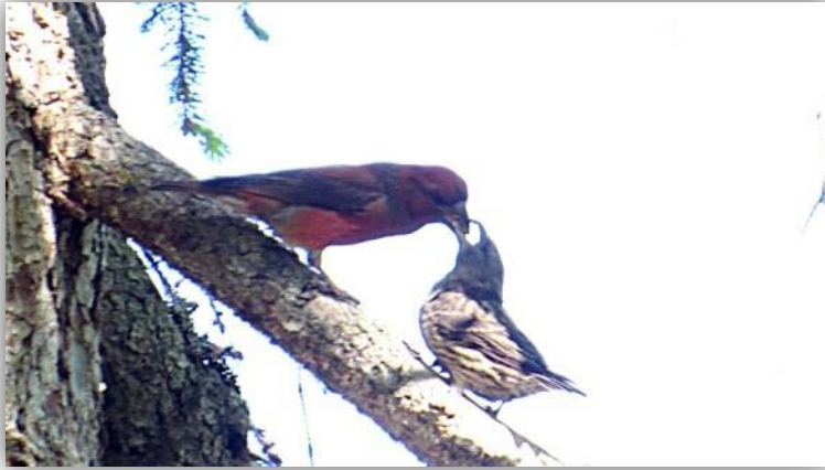
Fichtenkreuzschnabel [ Loxia curvirostra ]

klären. Bis diese um 9:Uhr öffnet ist noch Zeit für Beobachtungen in der Nähe am Oulanka Fluss. Das Ergebnis ist Wasserramsel, Bergfink und Fichtenkreuzschnabel.