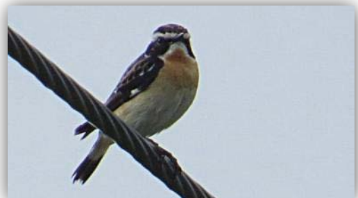
Braunkehlchen [ Saxicola rubetra ]