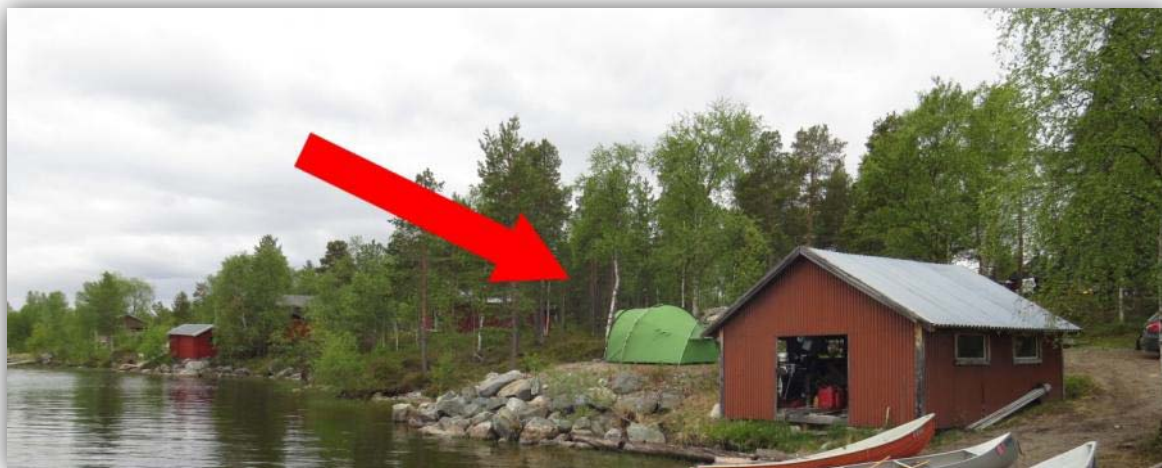
Unser Zeltplatz am See.

An einer Einfahrt kurz vor dem Zeltplatz sahen wir eine großen Nager bzw. einen Lemming über den See fliegen. Er war in den Krallen einer Sumpfohreule. Die Eule flog über den See und hatte dort wahrscheinlich ihre Jungen zu versorgen.