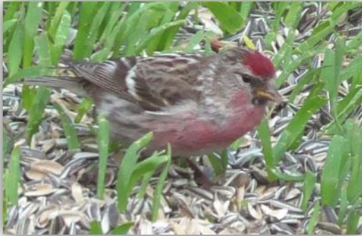
Birkenzeisig [Carduelis flammea]