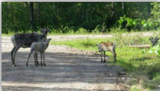
Rentier [ Rangifer tarandus ]