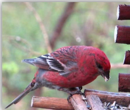
Hakengimpel [Pinicola enucleator] an der Futterstelle

Am nächsten Morgen beim Frühstück sahen wir sie, die Hakengimpel. Zu beobachten waren mindestens ein Männchen und mehrere Weibchen. Die Vogelfütterung ist so angelegt, dass man die Futterstelle durchs Fenster im Frühstücksraum betrachten kann. Bei der Gelegenheit hüpfte noch eine Lapplandmeise im Geäst herum, die in der Nähe in einem Nistkasten Brütete. Weiterhin hielten sich am Futterplatz noch etliche Erlen- und Birkenzeisige, Grün- und Bergfinken auf.