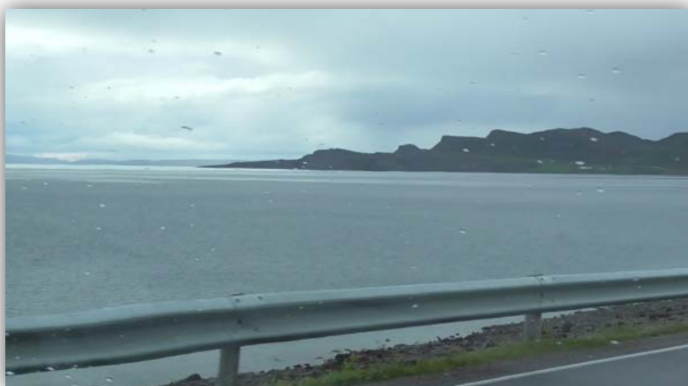
Endlich auf der Varanger Halbinsel

Wir checkten ein und gingen sofort auf Exkursion, das erste Ziel war das Naturschutzgebiet am Samimuseum bei Varangerbotn. Im Regen sahen wir als erstes den Polarbirkenzeisig.