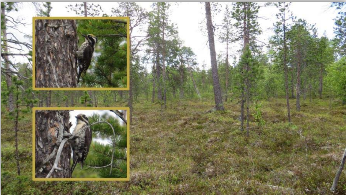
Dreizehenspecht [ Picoides tridactylus ] in der Taiga

Für diesen Tag hatten wir vor, eine Wanderung zu unternehmen, einen Weg den die netten Damen von der Nationalparkinformation vorgeschlagen hatten. Nach einiger Fahrt entlang einer Schotterpiste an einem Sumpfbgebiet mit Regenbrachvögeln vorbei hielten wir an einem Parkplatz an. Unterwegs trafen wir auch Birder aus Oslo, die wir dann auch prompt Abends auf unserem Zeltplatz wieder trafen. Auf dieser Wanderung begegnete uns als einziges Highlight ein Dreizehenspecht. In der Taiga sind nicht so viele Arten anzutreffen.