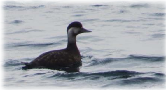
Trauerente ♀ [ Phylloscopus trochilus ]