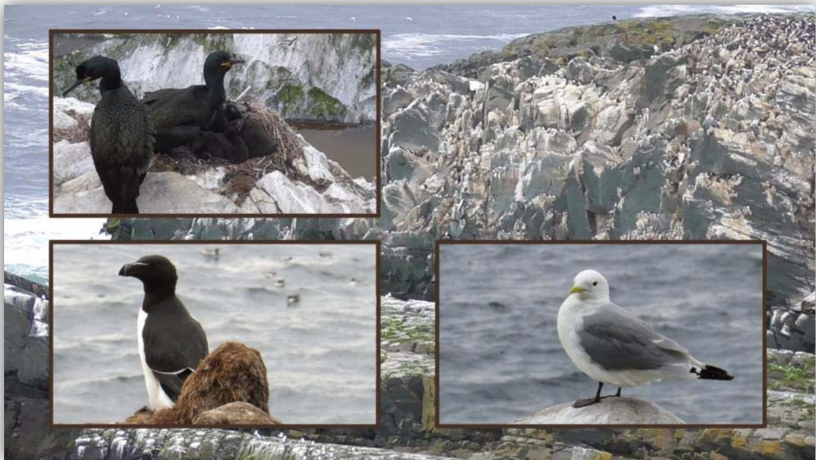
Krähenscharben [ Phalacrocorax aristotelis ], Tordalk [ Alca torda ] und Dreizehenmöwen [ Rissa tridactyla ] auf Hornøya