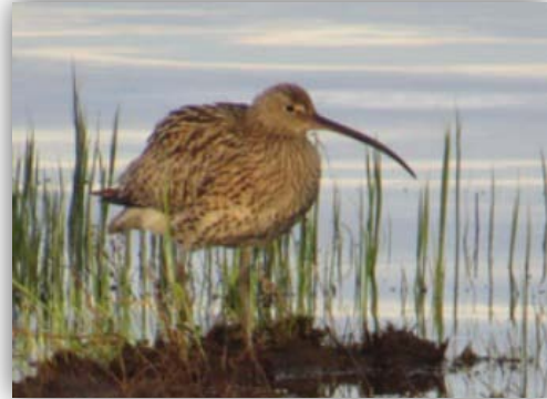
Großer Brachvogel [Numenius arquata] am See eines Zeltplatzes

08.06.-09.06.2015: In Finnland machten wir kurz halt am Polarkreis, der recht kräftig vermarktet wird. Dort in Finnland soll ja der Weihnachtsmann wohnen. Entsprechend ist dort eine permanente Lautsprecherbeschallung mit Weihnachtsmusik (wir waren im Juni dort) und es gibt etliche Läden mit Weihnachtsdekoration wo man sich mit Weihnachtsartikeln, aber auch mit landestypischer Volkskunst eindecken kann.