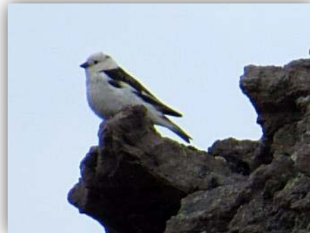
Schneeammer [ Plectrophenax nivalis ]