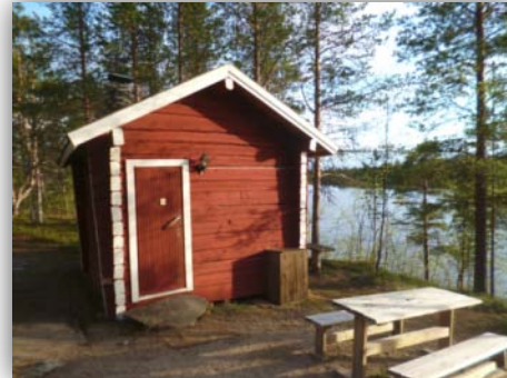
Unsere Unterkunft in der Neljän Tuulen Tupa, der Hakengimpellodge