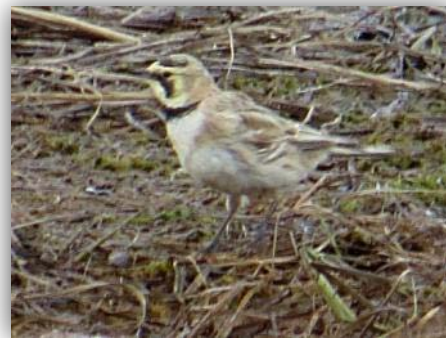
Ohrenlerche [ Eremophila alpestris ]