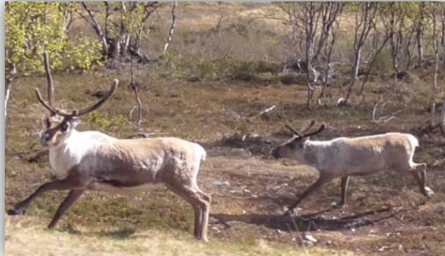
Rentiere [Rangifer tarandus]. Diese Nutztiere waren häufig am Straßenrand zu sehen.

Auf der Varangerhalbinsel und Küsten sollen Sperbereule, Sumpfohreule, Mornell, Falkenraubmöwe und mit Glück Spatelraubmöwe (durchziehend) zu sehen sein. Speziell im Varangerfjord und der Nordküste der Varangerhalbinsel sollten sich noch Prachteiderenten und Scheckenten aufhalten.