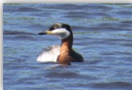
Rothalstaucher [Podiceps grisegena] in Wallnau