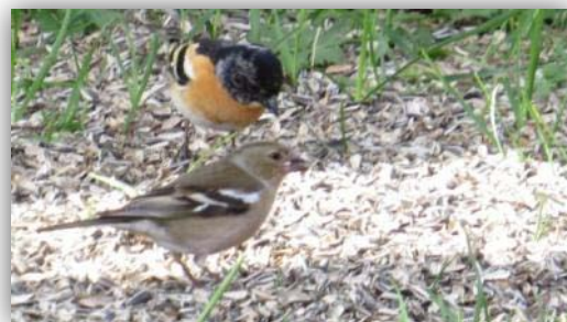
Buchfink [ Fringilla coelebs ] und Bergfink [ Fringilla montifringilla ]