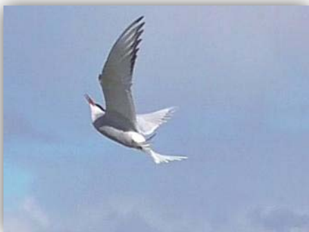
Küstenseeschwalbe [ Sterna paradisaea ]