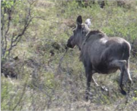
Das war die einzige Begegnung mit einem Elch [Alces alces] der in der Nähe der Straße äste.

gehalten werden, auf die man als Autofahrer achten sollte. Denn die Rentiere halten sich gern am Straßenrand oder mitten auf der Straße auf.