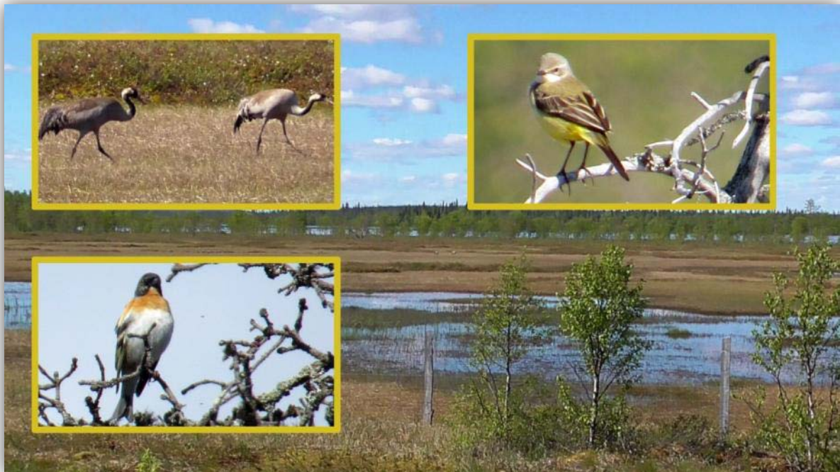
Rast am LINTULUONTOPOLKU Kraniche [ Grus grus ], Schafstelze [ Motacilla flava ] und Bergfink [ Fringilla montifringilla ]

Wir buchten über das Internet die Fährverbindung Turku - Stockholm zur bereits ab Deutschland gebuchten Fährverbindung Trelleborg Rostock hinzu. Wir hatten auch Übernachtung in Güstrow gebucht - die Fähre sollte erst ab 18:00 Uhr in Rostock sein.