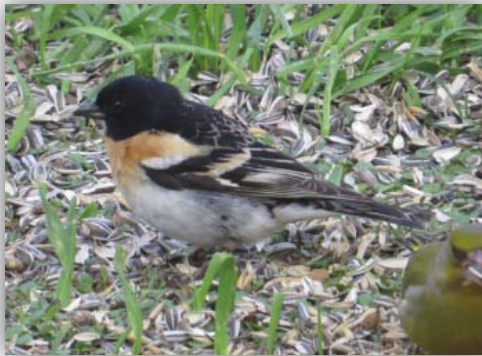
Bergfink [Fringilla montifringilla]