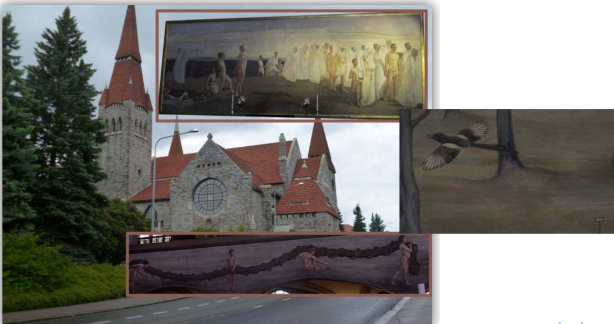
Der Dom in Tempere

Wir fuhren Richtung Turko, wo unsere Fähre nach Stockholm abgehen soll. Bei einem Zwischenstopp in Tempere besichtigten wir noch den Dom, der im Jugendstil errichtet wurde, und erhielten noch einige Erklärungen zu den eigenwilligen Bildern, mit denen der Maler die Kirche ausgestattet hat. (Hinter dem Altar ist ein Bild, auf dem der Jüngste Tag abgebildet ist). An den Emporen sind die 12 Apostel als Jünglinge dargestellt, ganz hinten Judas und die wegfliegende Elster soll die Scham symbolisieren)