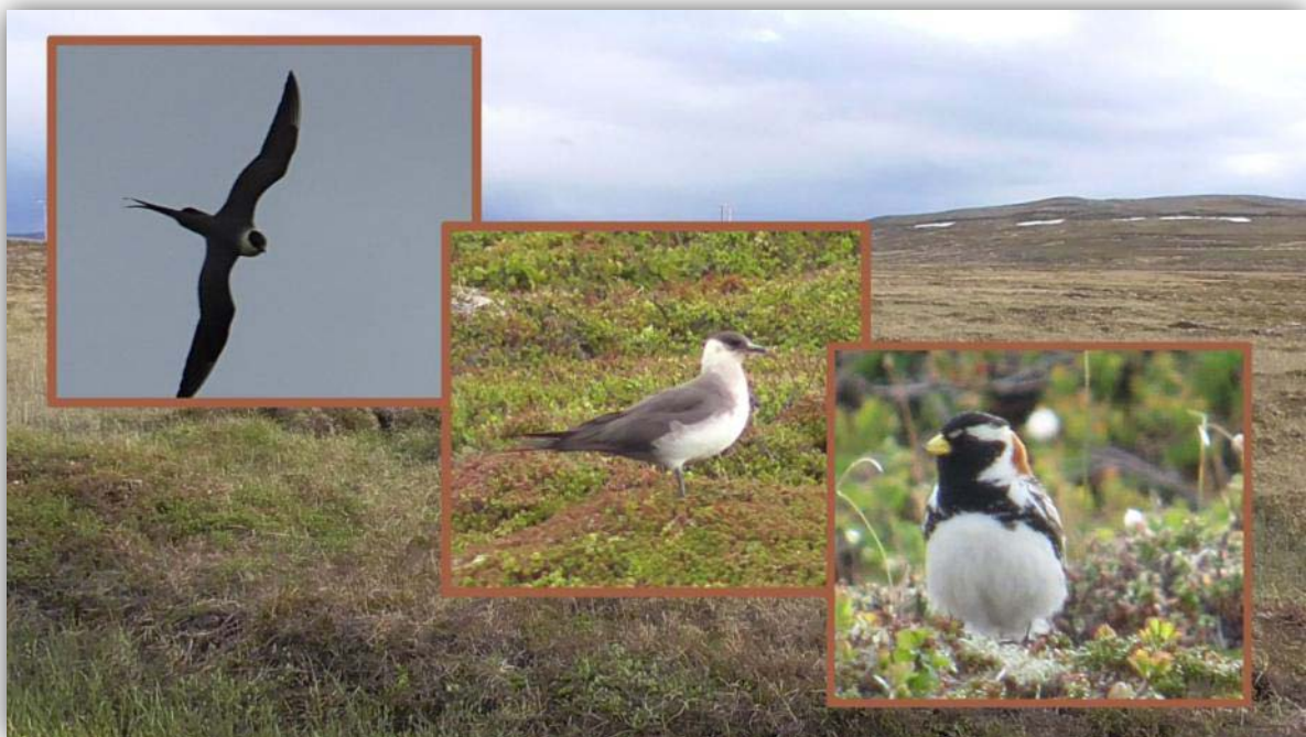
Falkenraubmöwe [ Stercorarius longicaudus ], Schmarotzerraubmöwe [ Stercorarius parasiticus ] und Spornammer [ Calcarius lapponicus ] auf dem Weg nach Hammingberg.

Da wir nach unserem Besuch auf der Vogelinsel noch Zeit hatten, fuhren wir nach Hammingberg. Einer sehr schönen an der Küste entlangführenden Straße entlang. Bei einigen Stopps sahen wir Basstöpel, Schmarotzerraubmöwen, Falkenraubmöwen, 2 Seeadler und eine Spornammer. In Hammingberg erwartete uns eine schöne Küstenlinie, an der man im Mai (und mit Glück wohl auch noch im Juni) vorbeiziehende Spatelraubmöwen sehen kann. Wir sahen in der Ferne jagende Basstöpel und große Raubmöwen, aber eine Bestimmung war uns nicht möglich.