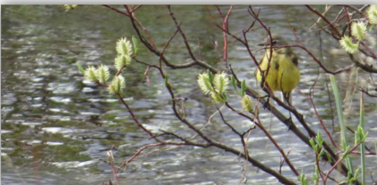
Schafstelze [Motacilla flava] am Bachufer.

Jedenfalls sahen wir die Sperbereule nicht. Lediglich einen Turmfalken, eine Schafstelze und die allgegenwärtigen Wacholderdrosseln. Die Sperbereule sollte uns auf dieser Reise noch eine ganze Weile beschäftigen und überraschen. Auch die Sumpfohreule die hier auch gesehen worden ist, ließ und im Stich. Auch mit Ihr sollten wir später noch eine kleine Überraschung erleben.