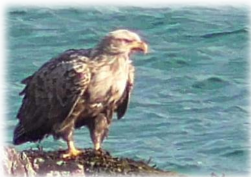
Seeadler [ Haliaeetus albicilla ]

Da wir am nächsten Tag die Vogelinsel Hornøya besuchen wollten, fuhren wir nach Vardø. Von dort aus geht eine Fähre zur Vogelinsel, und da der Weg vom Zeltplatz nach Vardø weit ist, ist es gut wenn man schon mal weiß von welcher Stelle die Fähre abfährt. Bei der Rückfahrt sahen wir 5 Seeadler.