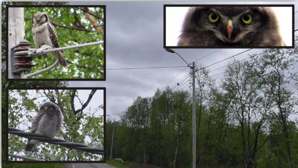
Sperbereulen [ Surnia ulula ] am Straßenrand