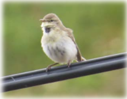
Fitis [ Phylloscopus trochilus ]

12.06.-14.06.2015: Die Vogelinsel Hornøya ist ein Erlebnis. Nach der Überfahrt und Ankunft auf der Insel, befand man sich inmitten einer Brutkolonie von Tordalken, Trottellummen, Krähscharben und Papageitauchern an den arttypischen Niststellen. Noch nie waren wir so nah inmitten einer Brutkolonie. Die Vögel ließen sich durch uns nicht stören und segelten im Abstand von zwei Metern an uns vorbei. Gefährlich waren die entsprechenden Hinterlassenschaften aus der Luft. Wir taten gut daran unsere Wintersachen mitzunehmen, denn auf der Insel war es unheimlich zugig und kalt. Das hielt aber einen kleinen Fitis nicht ab unermüdlich auf einer Stromleitung sein Lied zu singen.