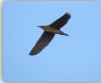
Große Rohrdommel [Botaurus stellaris] über dem Zeltplatz fliegend

Am nächsten Tag unternahmen wir eine Exkursion zum Nabu-Wasservogelreservat Wallnau. Dort überraschte uns eine verhältnismäßig große Dichte an Rothalstauchern (min. 3 Paare + einzelne Exemplare auf der Ostsee). Wir als Binnenländer sind es nicht gewohnt, mehrere Nester dieser Art nahe den Wanderwegen zu sehen. Weiterhin eröffneten die nach Biotopen angeordneten Beobachtungshütten Einblicke in das vielseitige Gebiet. Wir sahen viele Bluthänflinge, Neuntöter, Grauschnäpper, Feldlerche, Bachstelze, Brandgänse, Löffelente, Reiherente, Kolbenente, Tafelente, Kranich, Flußseeschwalbe, Zwergseeschwalbe (2 Stück), Rotschenkel, Kuckuck, Rauch- und Mehlschwalben, Mittelsäger etc. Abends wieder am Zeltplatz die Große Rohrdommel überfliegend.