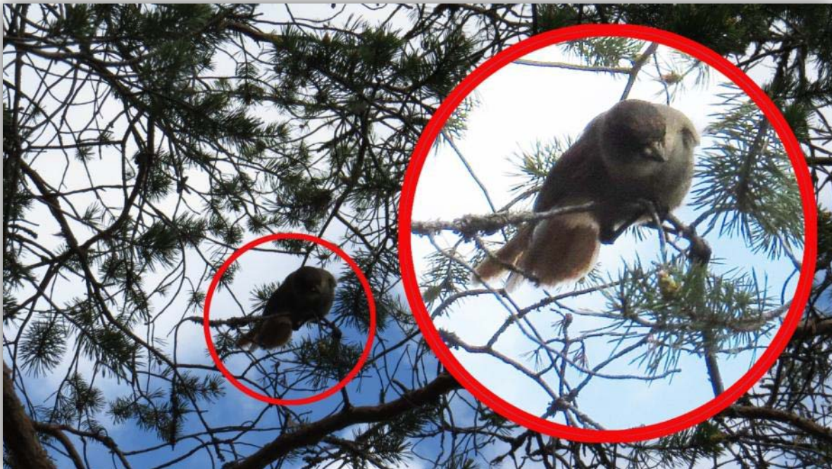
Das einzige Foto des Unglückshähers [ Perisoreus infaustus ]

Wir holten unser Mückenspray heraus, was etwas Abhilfe schaffte. Nach einiger Wanderung durch Sumpf, Wald und Mücken war ein seltsames uns unbekanntes gekrächzte hoch in den Bäumen näherkommend zu hören. Dann kam er. Der Unglückshäher. Er kam neugierig heran setzte sich auf einen Baum direkt vor uns, er stellte sich uns vor, beschaute uns und flog gelangweilt weiter. Ich wollte den Fotoapparat zücken, das Umhängeband verhedderte sich an den Trägern des Rucksacks und es entstand in gekrümmter Haltung ohne richtig durch den Sucher zu schauen ein einziges Foto. Abhilfe sollte auf die Schnelle die griffbereite Videokamera schaffen. Aber im Display spiegelte sich alles und der Vogel konnte im Display nicht gesehen werden.