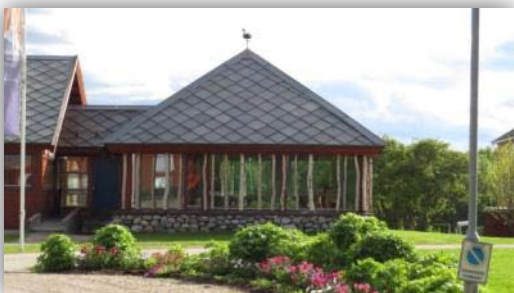
Das Nationalparkzentrum von Øvre Passvik

Auf einem See waren Singschwäne. Nach einem weiteren Besuch des Informationszentrums, wir hatten dort Mittag gegessen, stand noch ein empfohlener Vogelbeobachtungsturm auf unserem Programm.