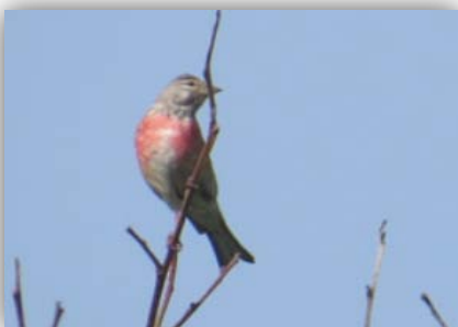
Bluthänfling [Carduelis cannabina]

Am nächsten Tag unternahmen wir eine Exkursion zum Nabu-Wasservogelreservat Wallnau. Dort überraschte uns eine verhältnismäßig große Dichte an Rothalstauchern (min. 3 Paare + einzelne Exemplare auf der Ostsee). Wir als Binnenländer sind es nicht gewohnt, mehrere Nester dieser Art nahe den Wanderwegen zu sehen. Weiterhin eröffneten die nach Biotopen angeordneten Beobachtungshütten Einblicke in das vielseitige Gebiet. Wir sahen viele Bluthänflinge, Neuntöter, Grauschnäpper, Feldlerche, Bachstelze, Brandgänse, Löffelente, Reiherente, Kolbenente, Tafelente, Kranich, Flußseeschwalbe, Zwergseeschwalbe (2 Stück), Rotschenkel, Kuckuck, Rauch- und Mehlschwalben, Mittelsäger etc. Abends wieder am Zeltplatz die Große Rohrdommel überfliegend.