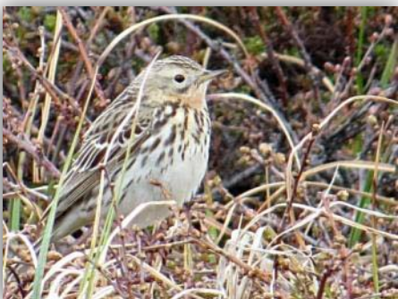
Rotkehlpieper [ Anthus cervinus ]