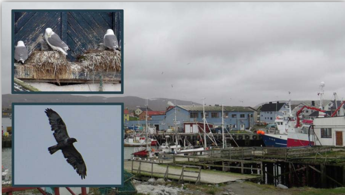
Berlevåg: Dreizehenmöwenkolonie [ Rissa tridactyla ] an der Fischfabrik und fliegender Raufußbussard [ Buteo lagopus ].

nisten. Wir beschlossen im örtlichen Fischladen Fisch zu kaufen und uns diesen am Abend zuzubereiten. Es war ein vorzügliches Abendessen.