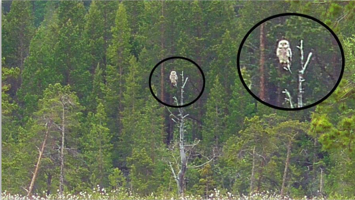
Sumpfohreule in der Ferne

Dort trafen wir doch tatsächlich noch einmal die norwegischen Birder und wir entdeckten gemeinsam eine in großer Entfernung sitzende Sumpfohreule.