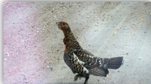
Auerhenne [ Tetrao urogallus ]

An der Bucht angekommen lag zum Glück das Boot schon auf unserer Seite. Wir mussten nur noch unsere Wanderschuhe anziehen unser Gepäck nehmen und rüber rudern. Es war sehr schwül. Zum Glück war etwas Wind auf offenem Wasser was aber das Rudern sehr erschwerte. Das andere Ufer war etwas sumpfig, das Boot ließ sich nicht ganz ans Ufer rudern und es gab keinen festen Grund wo man auftreten konnte. Es war wieder schwül und wir wurden freudig empfangen.