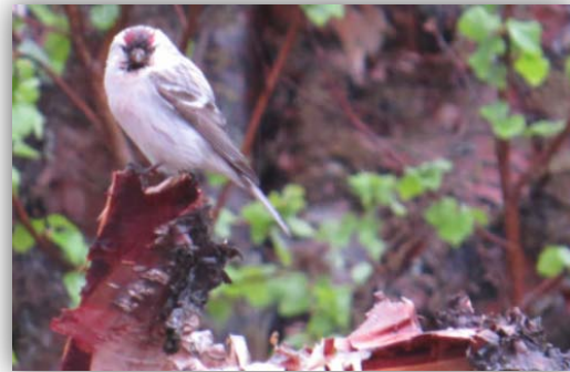
Im Regen flogen zwei Polarbirkenzeisige [ Carduelis hornemanni ] umher.

11.06.2015: An diesem Tag unternahmen wir eine Exkursion nach Ekkerøy wo eine Riesige Kolonie von Dreizehenmöwen existiert und man mit etwas Glück Scheck- bzw. Prachteiderenten sehen kann. Wir sahen viele Dreizehenmöwen, einen Steinschmätzer, Eiderenten und viele Küstenseeschwalben.