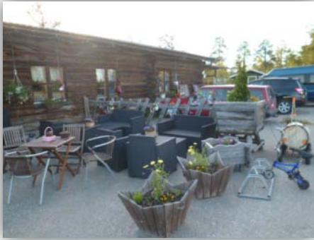
Die Neljän Tuulen Tupa, die Hakengimpellodge