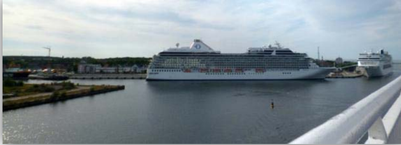
Einfahrt in den Rostocker Hafen

27.06.2015: Nach zwei Zwischenstopps in Schweden geht um 10:00 Uhr die Fähre von Trelleborg nach Rostock. Die Fahrt verlief sehr eintönig. Am interessantesten war noch die Einfahrt in den Rostocker Hafen.