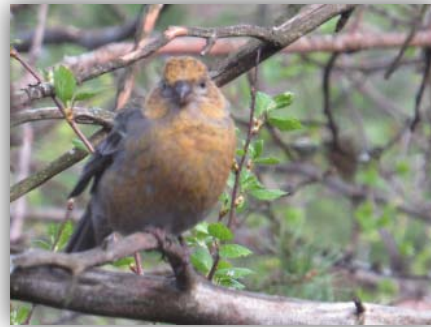
Hakengimpel [Pinicola enucleator]

09.06-10.06.2015: Nach dem Auschecken schauten wir noch am Wegesrand nach der Sperbereule. Ein Birder, der sich für einige Tage in der Lodge eingemietet hatte gab uns den Tipp.