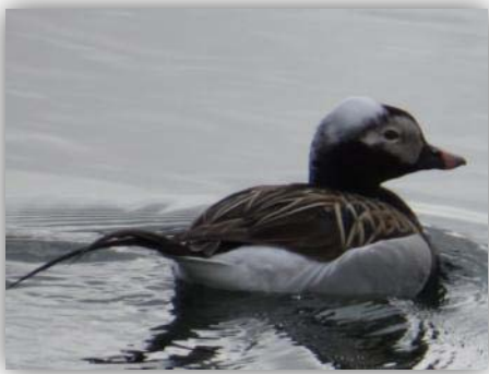
Eisente [ Clangula hyemalis ]