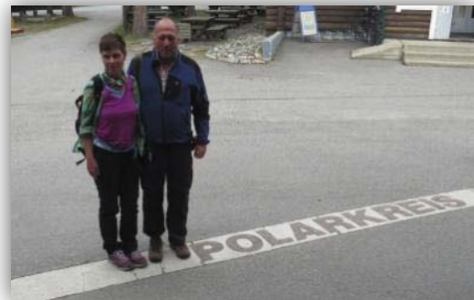
Auf dem Polarkreis

Unser nächstes Geplantes Ziel war die Hakengimpel Lodge. Die Neljän Tuulen Tupa nahe von Kaamanen nördlich des Polarkreises. Wir hatten im Vorfeld über das Internet eine Übernachtung in einer der dort angebotenen Hütten gebucht. Diese Lodge zeichnet sich dadurch aus, dass deren Besitzer eine Vogelfütterung unterhalten, wo sich auch die seltenen Hakengimpel einfinden sollen. Nach einem guten Abendessen in der Hagengimpellodge schlichen wir ums Haus zur Futterstelle und sahen lediglich ein paar Erlenzeisige, Birkenzeisige, Bergfinken und einen Trauerschnäpper.