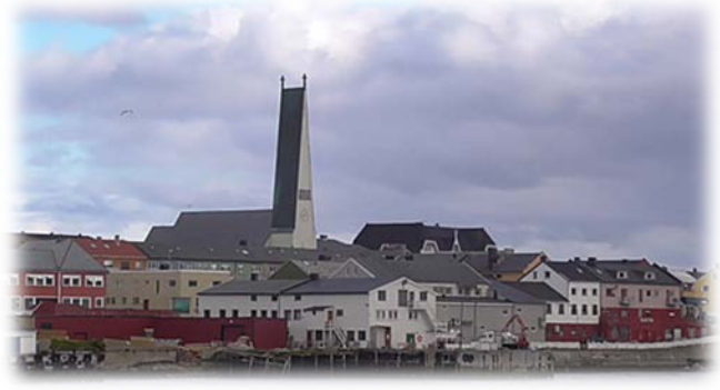
Vardø vom Hafen aus gesehen