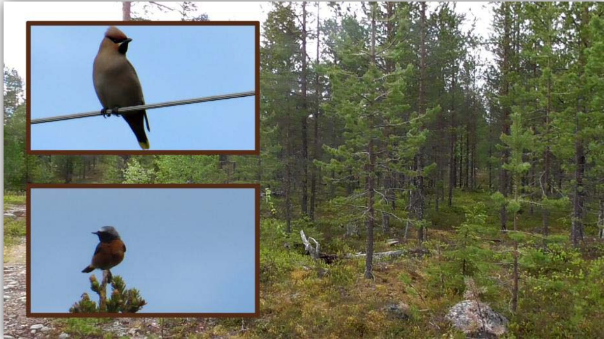
Seidenschwanz [ Bombycilla garrulus ] und Gartenrotschwanz [ Phoenicurus phoenicurus ]

Wir packten unser Zelt ein und machten wiederholt eine Wanderung in der Nähe von Salla. Sahen noch den Trauerschnäpper und einen singenden Gartenrotschwanz. Das war der letzte Versuch noch einmal den Unglückshäher richtig zu Gesicht zu bekommen. Nichts. Nur der singende Gartenrotschwanz und am Straßenrand ein Seidenschwanz.