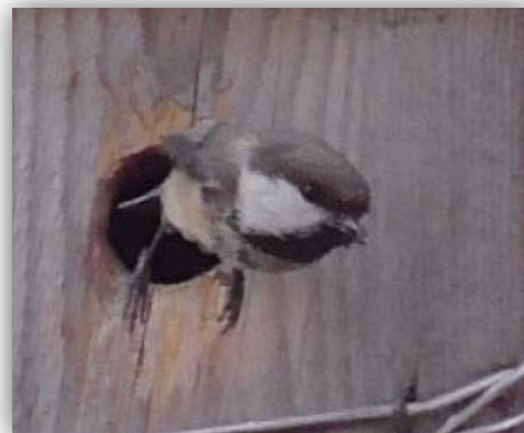
Lapplandmeise [Poecile cinctus] am Nistkasten