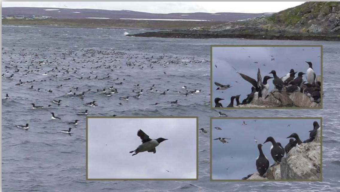
Trottellummen [ Uria aalge ] Auf Hornøya