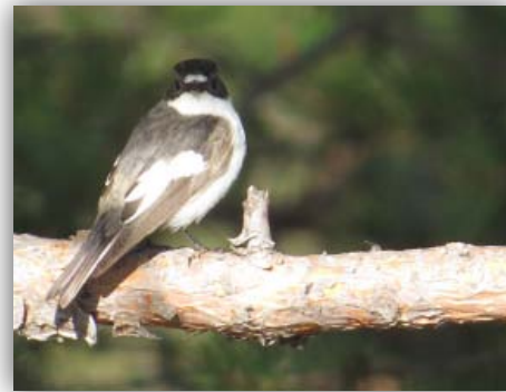
Trauerschnäpper [Ficedula hypoleuca]