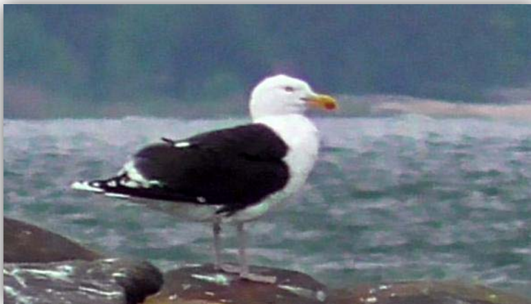
Heringsmöwe [ Larus fuscus fuscus ]

Schon am Eingang des Zeltplatzes empfängt die Besucher eine Gruppe von mehr als 20 Weißwangengänsen. Auch am Badestrand sind mehrere führende Gänse. Sie In Ruhe gelassen von den Gästen des Strandes. Auf den Schäreninseln vor Turku saßen und flogen einige der Baltischen Heringsmöwe Larus fuscus fuscus , Sturmmöwen und Eiderenten.