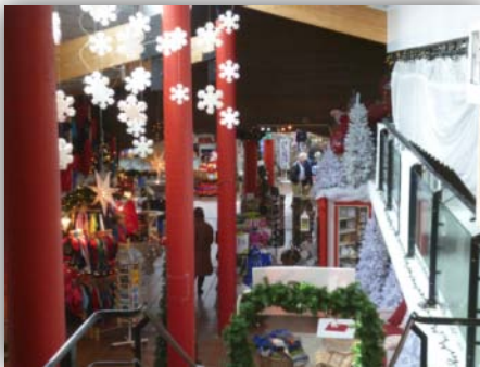
Geschäft am Polarkreis