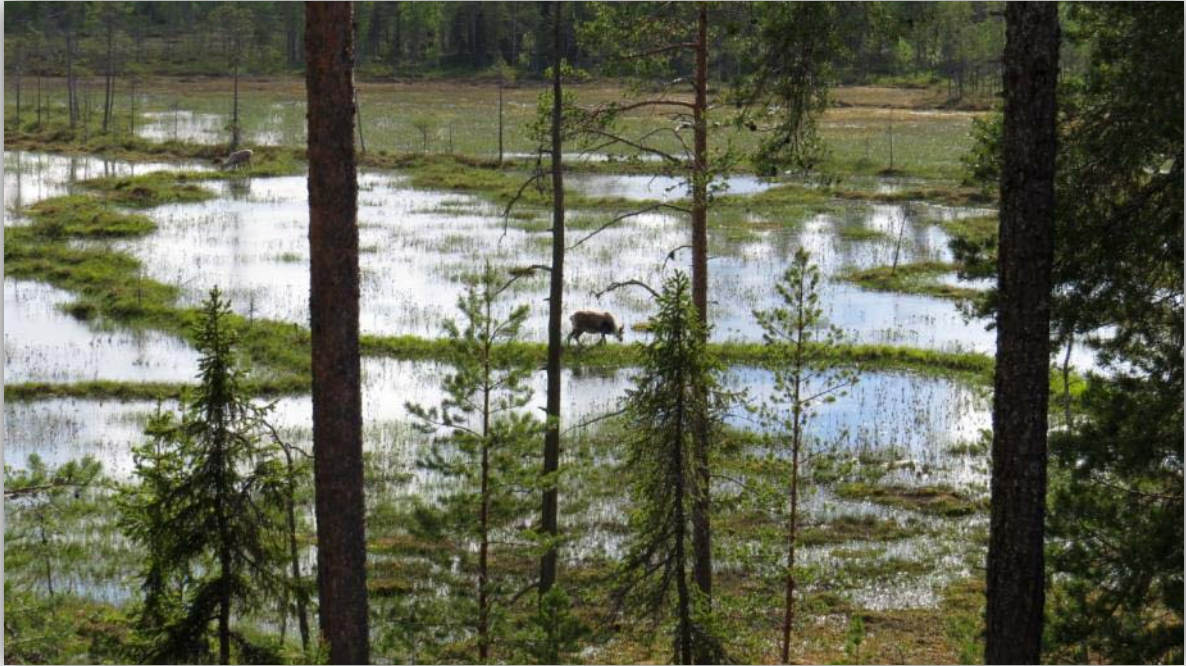
Der Oulanka Nationalpark

bleiben? Wir zogen am Boot die Schuhe aus um ins und aus dem Boot zukommen. Die Mücken nutzten die Situation natürlich aus, sie hatten nun etwas mehr Angriffsfläche.