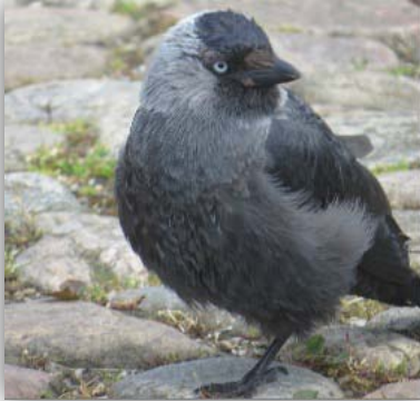
Dohle [Corvus monedula] am Rastplatz

06.06.-09.06.2015: Nach dem durchfahren von Dänemark und dem überqueren der Øresundbrücke fuhren wir im wesentlichen durch Schweden an der Ostseeküste entlang. An der Strecke und diversen Zeltplätzen waren Kuckuck, Singdrossel, Rauch- und Mehlschwabe, Singschwan, Eichelhäher, Großer Brachvogel, Pfeifente, Zwergmöwe, Gänsesäger, Goldammer, Buchfink, Bergfink, Wacholderdrossel zu sehen.