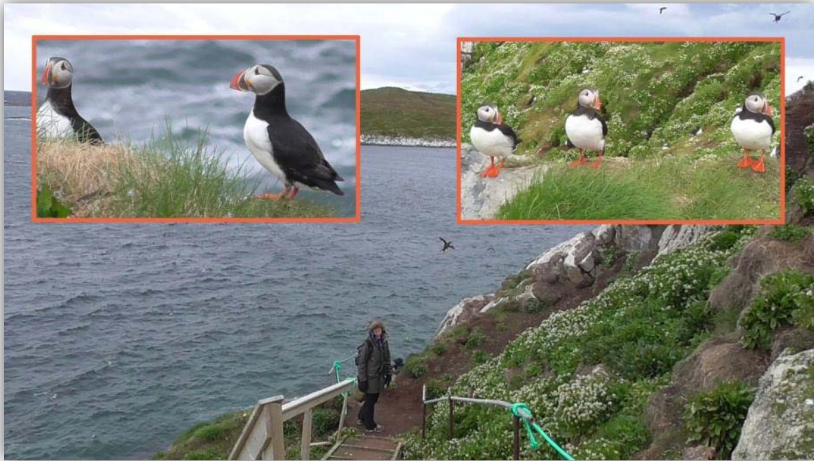
Die Papageitaucher [ Fratercula arctica ] waren von den Wegen aus gut zu sehen