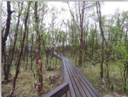
Das Schutzgebiet hinter dem Samimuseum

Von den Beobachtungshütten aus, die in Richtung Fjord ausgerichtet waren war nicht viel zu sehen, nur ein paar Austernfischer und ein Seeadler. Wir beschlossen noch zur Kirche von Nesseby zu fahren wo eine gute Beobachtungsstelle beschrieben wird, und vor einiger Zeit eine Sumpfohreule umhergeflogen sein soll. Am Parkplatz der Kirche von Nesseby fanden wir eine kleine Gemeinde von Birdern vor, mit denen wir wieder schnell ins Gespräch kamen. Wir gaben Tipps zum Polarbirkenzeisig und zur Hakengimpellodge und wir erhielten Tipps für den Mornell und Scheck- bzw. Prachteiderenten. Einen Teil der Leute trafen wir am nächsten Morgen auf unserem Zeltplatz wieder.